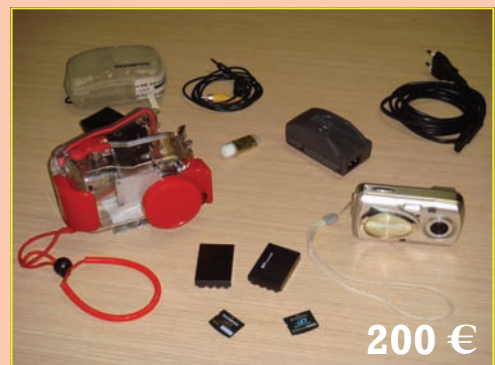
Cámara Pentax, con caja estanca y accesorios