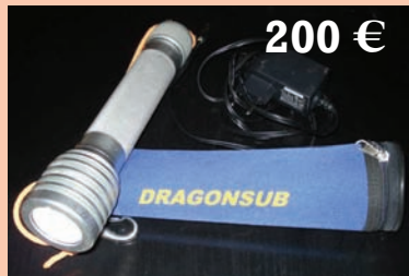
Foco Dragon-Sub 7 Leds + cargador y funda