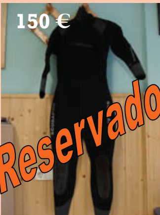
Traje Semi-seco Scubapro Lady