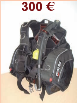
Mares Vector 1000