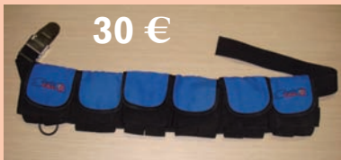
Cinturón de plomos