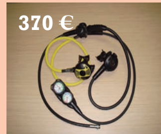
Regulador Scubapro 395 Octopus Cressi y consola de 3 elementos